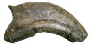
中川町で発見されたテリジノサウルス類のツメ化石（上）と生体復元図（下）